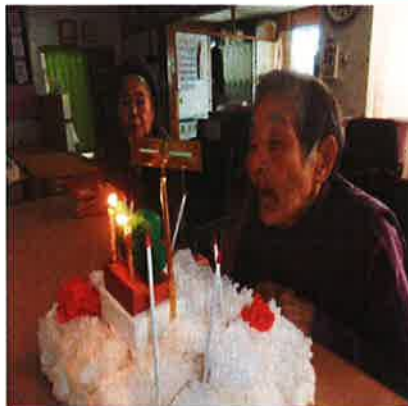
先月、88歳の誕生日を迎えられた盛様。いつまでもお元気で。